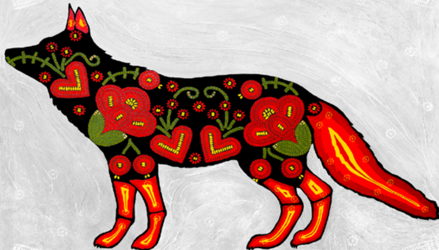
Observant and Unassuming

Le RCSF déploie tous les efforts nécessaires pour fournir de l'information aux divers intervenants, aussi bien aux agences commanditaires à l'échelle fédérale, provinciale et territoriale qu'à la communauté d'experts en santé de la faune en général. Il fournit aussi des renseignements importants à l'aide de fiches d'information, d'articles de blogue et de messages dans les médias sociaux pour renseigner la population canadienne sur les signaux observés dans l'environnement.